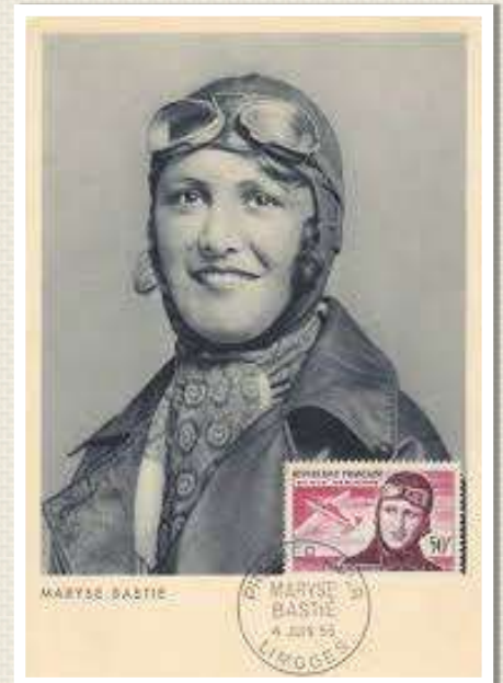
Maryse Bastié (1898 - 1952)