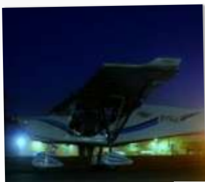
VOL À L'AUBE