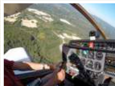
DR 400 F-EB L'AVION CONVIVIAL