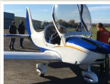
L'EUROSTAR SLX LE TGV DU CIEL