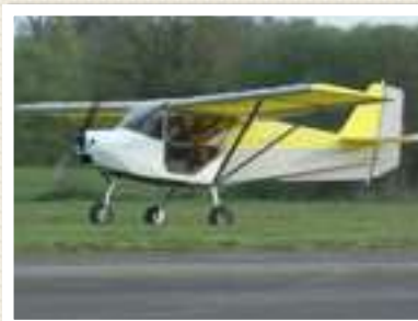
SKYRANGER LE 4X4 QUI PASSE PARTOUT