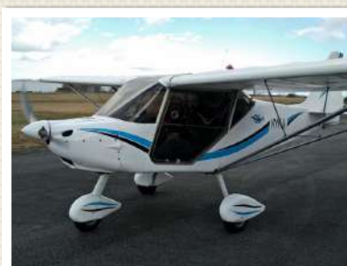
NYNJA L'ULM DE VOYAGE ...