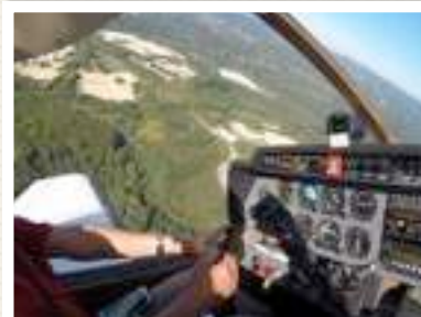
DR 400 F-DE L'AVION CONVIVIAL