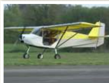
SKYRANGER LE 4X4 QUI PASSE PARTOUT