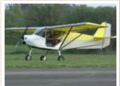
SKYRANGER LE 4X4 QUI PASSE PARTOUT