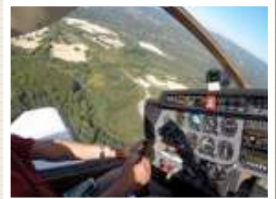
DR 400 F-DE L'AVION CONVIVIAL