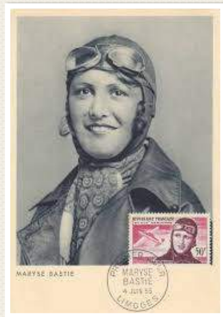
Maryse Bastié (1898 - 1952)