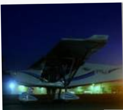
VOL À L'AUBE