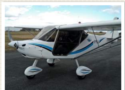
NYNJA L'ULM DE VOYAGE ...