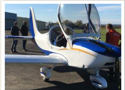
L'EUROSTAR NG LE TGV DU CIEL